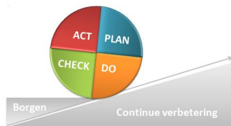
Fig. Cirkel van Deming

Mede door middel van deze verklaring wordt het personeel, personen die voor of namens ons bedrijf werkzaam zijn, (potentiële) opdrachtgevers en andere belanghebbenden op de hoogte gebracht van de reductiedoelstellingen die de directie heeft vastgesteld voor het bedrijf en, indien van toepassing, voor de projecten waarop een CO 2 -gerelateerde gunningvoordeel is verkregen.